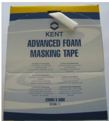
85386 Advanced Foam Masking Tape