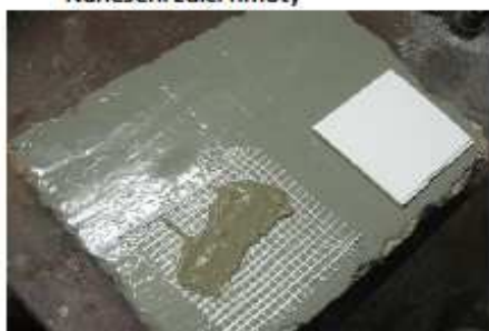
Nanesení zdicí hmoty