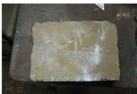
Přilepení dlaždice přímo na AquaSealer!